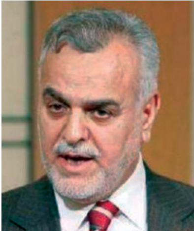
■ താരിഖ് ഹാശിമി

അടുത്ത ഇറാഖി പ്രധാനമന്ത്രി ആര്? ഇയാള് അലാവിയോ നൂർ മാലികിയോ? തെരഞ്ഞെടുപ്പ് ഫല പ്രഖ്യാപനം കഴിഞ്ഞ് ദിവസങ്ങൾ പിന്നിട്ടിട്ടും ഇനിയുമൊരു തീരുമാനമായിട്ടില്ല. മന്ത്രിസഭ രൂപവത്കരിക്കാൻ ആവശ്യമായ സീറ്റുകളുടെ (163) അടുത്തൊന്നും ഇരു മുന്നണിയും എത്തിയിട്ടില്ല എന്നതാണ് കാരണം. മുൻ പ്രധാനമന്ത്രി കൂടിയായ ഇയാദ് അലാവി നേതൃത്വം നൽകുന്ന ഇറാഖിയ്യ എന്ന ഇറാഖി നാഷണൽ മുവ്മെന്റിനാണ് കൂടുതൽ സീറ്റ്-91. തൊട്ടടുത്ത് നിലവിലുള്ള പ്രധാനമന്ത്രി നൂർ മാലികിയുടെ സ്റ്റേറ്റ് ഓഫ് ലോ മുന്നണി-89. ശീജു -കൂർദ് പാർട്ടികളെയോ തവാഹുഖ് എന്ന സുന്നി ഇസ്ലാമിക സഖ്യത്തെയോ ഒക്കെ കൂട്ടിക്കൊണ്ടേ ആർക്കും ഒരു മന്ത്രിസഭ തട്ടിപ്പടക്കാനാവൂ. അലാവിക്കാവും നറുക്ക് വീഴുക എന്ന് തുടക്കത്തിൽ പ്രതീക്ഷിക്കപ്പെട്ടിരുന്നെങ്കിലും ബഅ്സ് സോഷ്യലിസ്റ്റ് പാർട്ടിയുമായി ബന്ധമുണ്ടെന്ന് ആരോപിച്ച ആ സഖ്യത്തിലെ ആർ പാർലമെന്റ് അംഗങ്ങളെ അയോഗ്യരാക്കിയ നടപടി അദ്ദേഹത്തിന് തിരിച്ചടിയായിരിക്കുകയാണ്. ഇറാഖിന്റെ ഇടപെടലിനെതിരെ കടുത്ത ഭാഷയിൽ സംസാരിച്ചുകൊണ്ട് അമേരിക്കയുടെ പ്രീതി സമ്പാദിക്കുകയെന്ന തന്ത്രമാണ് ഇപ്പോൾ അലാവി പയറ്റിക്കൊണ്ടിരിക്കുന്നത്.