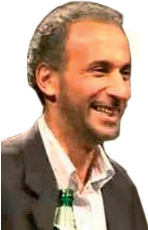
■ താരിഖ് റമദാൻ

ഇരുപത്തിയൊന്നാം നൂറ്റാണ്ടിലെ നൂറ് പ്രമുഖ വ്യക്തിത്വങ്ങളിലൊരാൾ എന്ന് ടൈം വാരിക. ലോകത്തിന്റെ ആത്മീയ നേതൃത്വം ഏറ്റെടുക്കാൻ പ്രാപ്തിയുള്ളയാൾ. ‘സ്വാലൂൻ’ എന്ന വെബ്സൈറ്റിൽ വിശേഷിപ്പിക്കുന്നത് മുസ്‌ലിംകളുടെ മാർട്ടിൻ ലൂഥർ എന്ന്. ജനീവയിലെ പത്ത് പ്രമുഖ വ്യക്തിത്വങ്ങളിലൊരാൾ എന്ന് 1990-ൽ പ്രസിദ്ധീകരിച്ച സർവേയിൽ ഒരു സിറ്റ്സർലന്റ് പത്രം. ആൾ മറ്റാരുമല്ല, താരിഖ് റമദാൻ. സിറ്റ്സർലന്റിലെ ഫ്രീബർഗ് സർവകലാശാലയിലും ജനീവ കോളേജിലും തത്ത്വശാസ്ത്രവും ഇസ്‌ലാമിക വിഷയങ്ങളും പഠിപ്പിക്കുന്ന പ്രഫസർ. പടിഞ്ഞാറൻ നാടുകളിലെ, പ്രത്യേകിച്ച് യൂറോപ്പിലെ ഇസ്‌ലാമിന്റെയും മുസ്‌ലിംകളുടെയും ഭാവിയെയും വർത്തമാനത്തെയും കുറിച്ച് ഏറ്റവും ശ്രദ്ധേയമായ നിരീക്ഷണങ്ങൾ നടത്തിയിട്ടുള്ള എഴുത്തുകാരൻ.