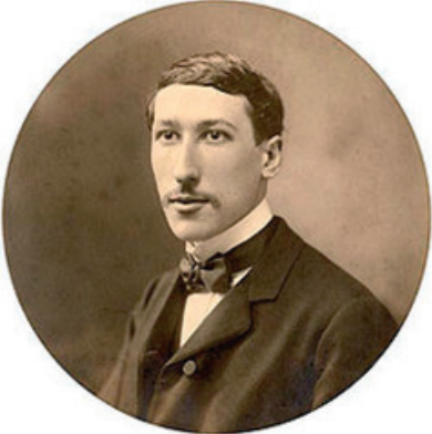
■ റെനെ ഗേനൻ

ണ്ട്. എന്നിട്ടും ഉള്ള ശക്തി മുഴുവൻ സംഭരിച്ച് അവർ ചെയ്തതെന്തെന്നോ? നിലത്തിറങ്ങി നിന്ന്, ഇരുമ്പു കട്ടിൽ നീക്കിയിട്ടു മക്കക്കു നേരെ മുഖം തിരിച്ച് മരിക്കാനാണ് പോലും! ഒരു 'മണ്ടൻ വിശ്വാസ'ത്തിനു വേണ്ടി കൂടുതൽ കഷ്ടപ്പാട് ഏറ്റുവാങ്ങിയതിനെപ്പറ്റി ഓർക്കുമ്പോഴേക്കും എന്റെ ചങ്ങാതിക്ക് അരിശം. എന്നാൽ എനിക്കോ? ആവേശകരമായ ഒരു സംഭവമായിട്ടാണ് എനിക്കത് തോന്നിയത്. ആ വിശ്വാസദാർഢ്യം! എനിക്ക് ഉറപ്പിക്കാവുന്ന ഏത് മാനസികാവസ്ഥക്കുമപ്പുറത്താണല്ലോ അത്.